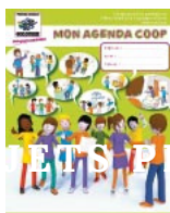
Agenda Cycle 2/3: 2€ l'unité + guide du maître 10€